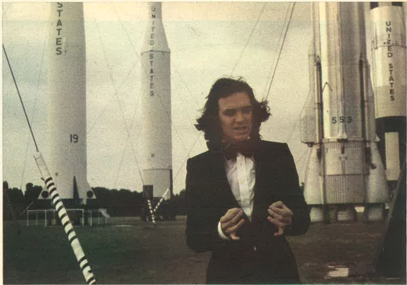
Con el impresionante fondo de los cohetes espaciales, Camilo Sesto graba una de las canciones para el programa que Televisión Española ofrecerá con motivo de fin de año