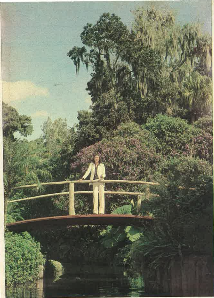
Camilo Sesto, fotografiado en el fabuloso Jardín de los Cipreses de Orlando, donde se ha rodado parte del «Especial Nochevieja»