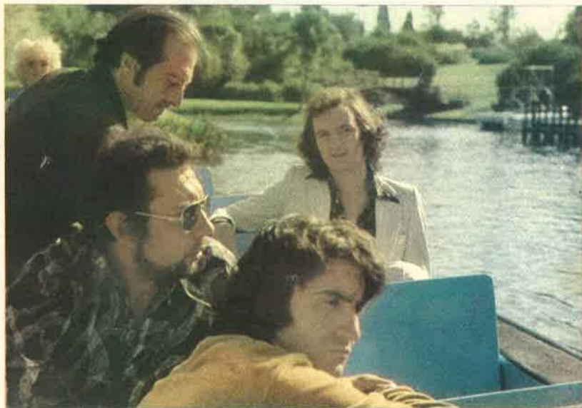
Estas cuatro fotografías, arriba y abajo, fueron obtenidas en el Jardín de los Cipreses, cuyo verdor sirve como escenario para que Camilo Sesto, bajo la dirección de Lazarov, grabe las canciones que toda España oír y verá en la última noche del año 1976 y los umbrales del 77