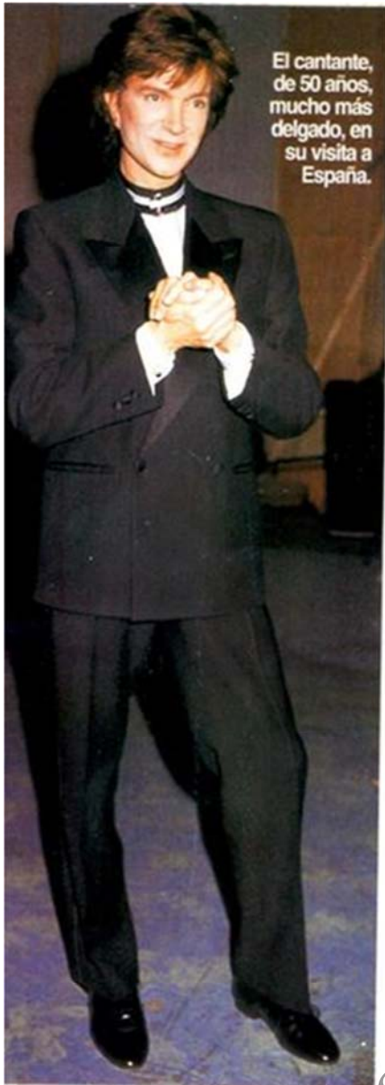
El cantante, de 50 años, mucho más delgado, en su visita a España.