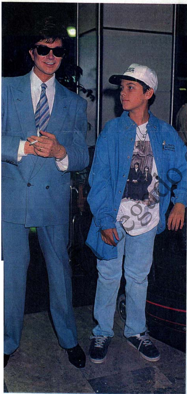
Camilo Sesto presumió de hijo en el aeropuerto.

★ El cantante no descarta la idea de fijar de nuevo su residencia en España