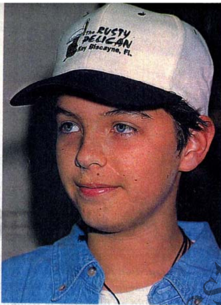
Camilín tiene 13 años y se parece a su padre.